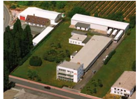
Datei: ARI KG.jpg, 300dpi, cmyk

Beispiel Haarklemme: dauernde Federkraft, auf die sich die Friseurin/der Friseur sicher verlassen kann, das ist das wesentliche. Und nur, wer wirklich echten und hochwertigen Federstahl in der Produktion verwendet, kann Federkraft und lange Verwendbarkeit garantieren.