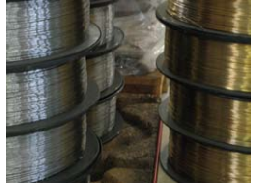
Datei: Rohstoff Draht.jpg, 300dpi, cmyk