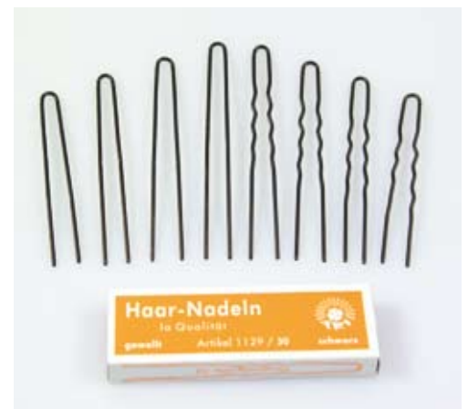
Datei: Haarnadeln.jpg, 300dpi, cmyk