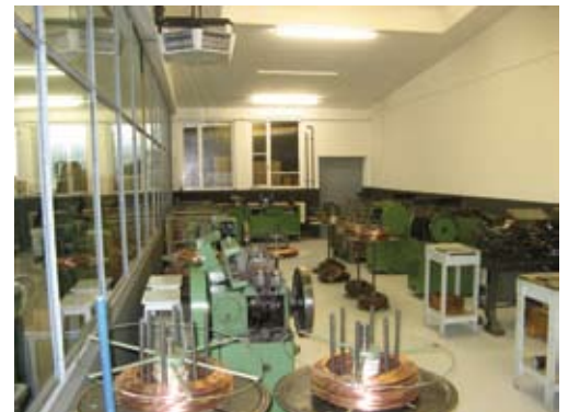
Datei: Fertigungshalle.jpg, 300dpi, cmyk